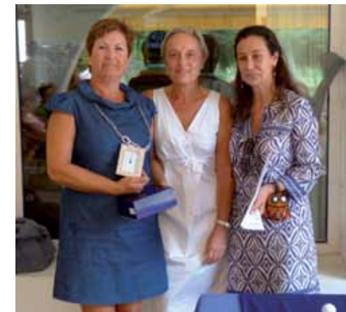
Participantes y ganadoras de la prueba

Trofeo Aesgolf Damas, Club de Golf El Bosque, 19 oct.