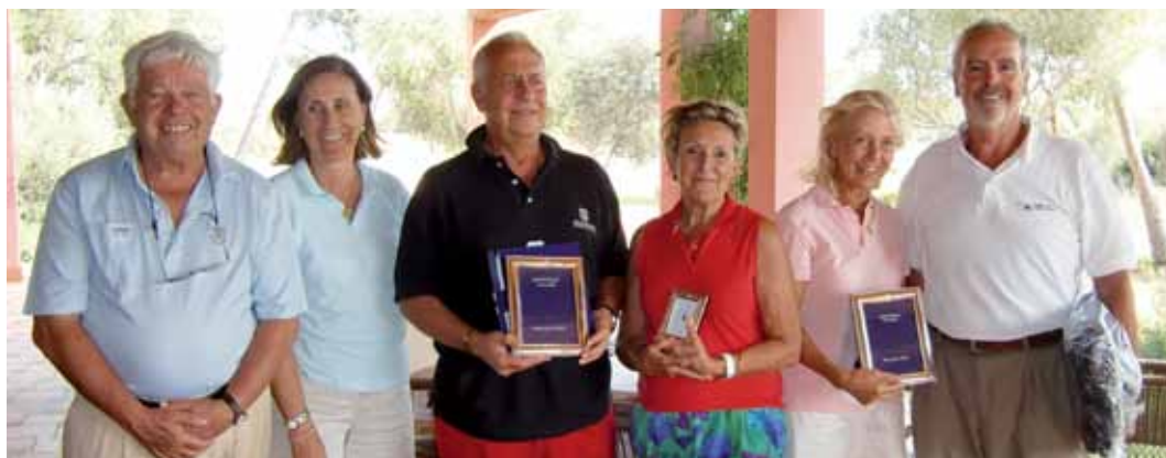
Los premiados posan con el delegado de Aesgolf en Baleares

Trofeo Aesgolf, Golf Maioris, 11 de septiembre