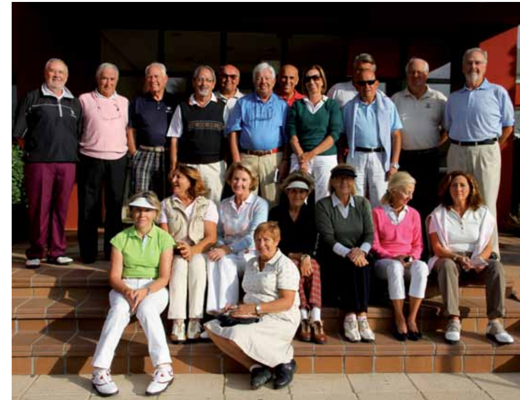
Los premiados posan en la casa club del club