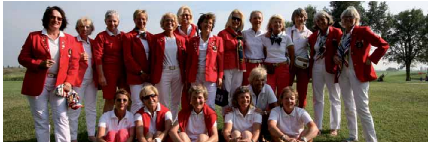
Equipo de Suiza