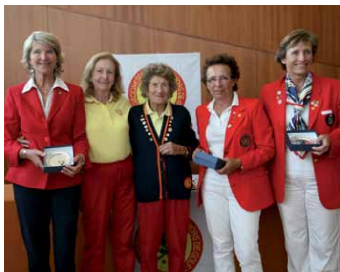
1º, 2º y 3º equipos clasificados en la Copa de la Amistad