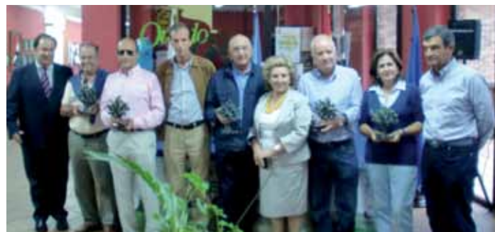
Los ganadores posan con sus trofeos

El día 22 de septiembre se celebró, en el campo de golf de Las Caldas, la edición de 2011 del Trofeo Carbayón de Oro, competición patrocinada por el Excmo. Ayto. de Oviedo. Como ocurrió en