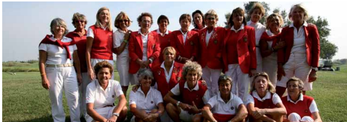
Equipo de Italia