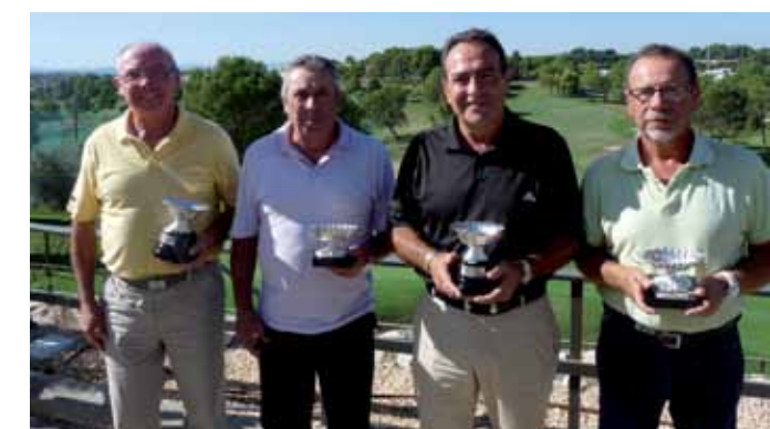
Los primeros clasificados, con sus Trofeos Aesgolf