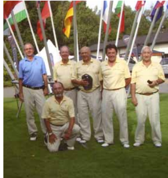
A la izda., el equipo Senior que participó en Bratislava. A la dcha., el equipo hándicap master senior campeón en Bonn