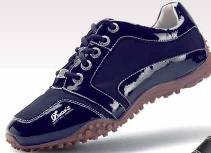
Modelo HEMISPHERE Azul de señora

Barcelona 934752030 - Madrid 911265293 - Marbella 610702283 / golfclassic@ golfclassic.es / www.ducadelcosma.com