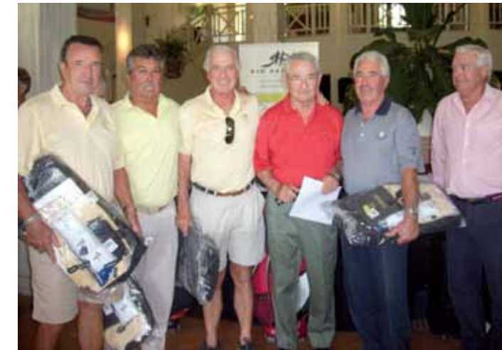
Algunos de los ganadores