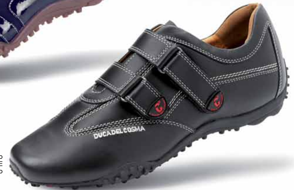
Modelo NEROMARE Negro de caballero