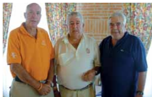
1º y 2º clasificados de 2ª categoría