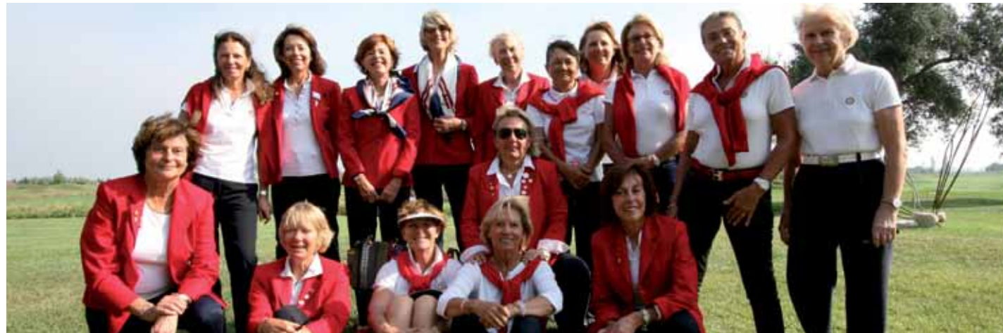
Equipo de Francia