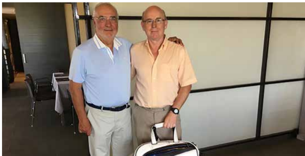
TROFEO AESGOLF GRAN PRIX FED. CAT., Lumine Golf, 4 de junio de 2016