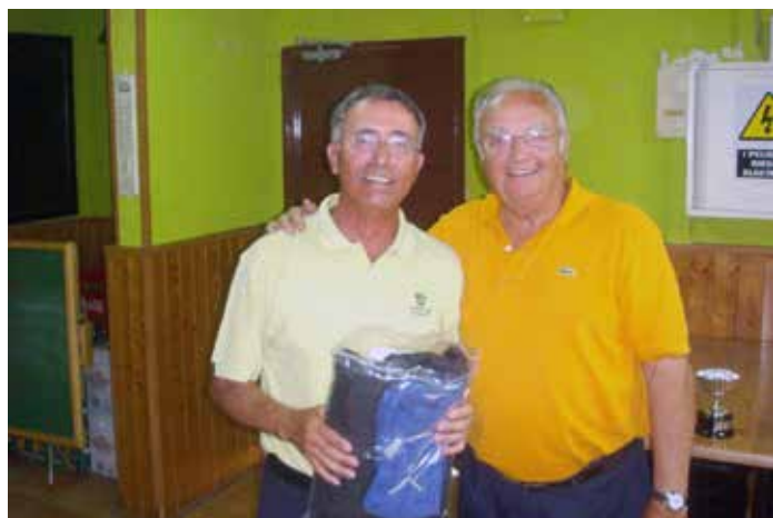
TROFEO AESGOLF Aranjuez 10 de junio de 2016