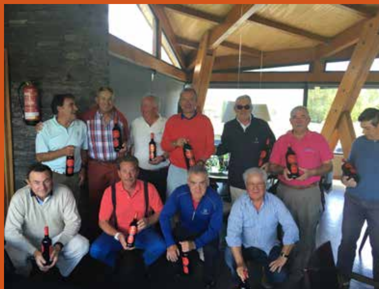
CAMPEONATO DE ESPAÑA SENIOR AESGOLF PING NUEVOCRISTALINO