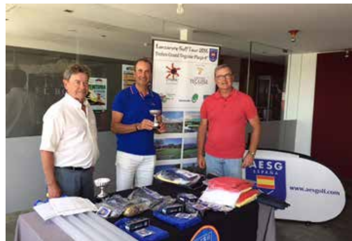
LANZAROTE GOLF TOUR AESGOLF CABALLEROS TROFEO GRAND TEGUISE PLAYA, El Bosque Club de Golf 7 de junio 2016