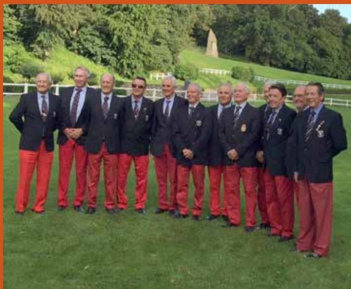
¡SUBCAMPEONES DE EUROPA MÁSTER SENIOR EN BÉLGICA!