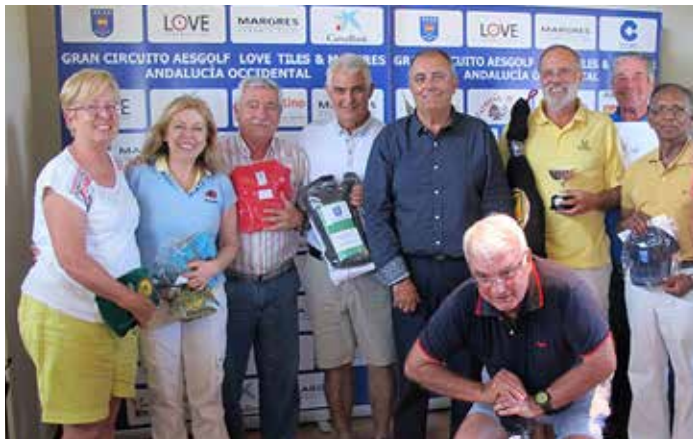
GRAN CIRCUITO AESGOLF LOVE TILES MARGRES, Hato Verde C.G., 23 de junio de 2016