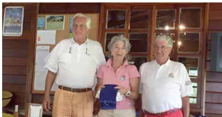
TROFEO AESGOLF 2016 Val de Rois Club 23 de junio de 2016