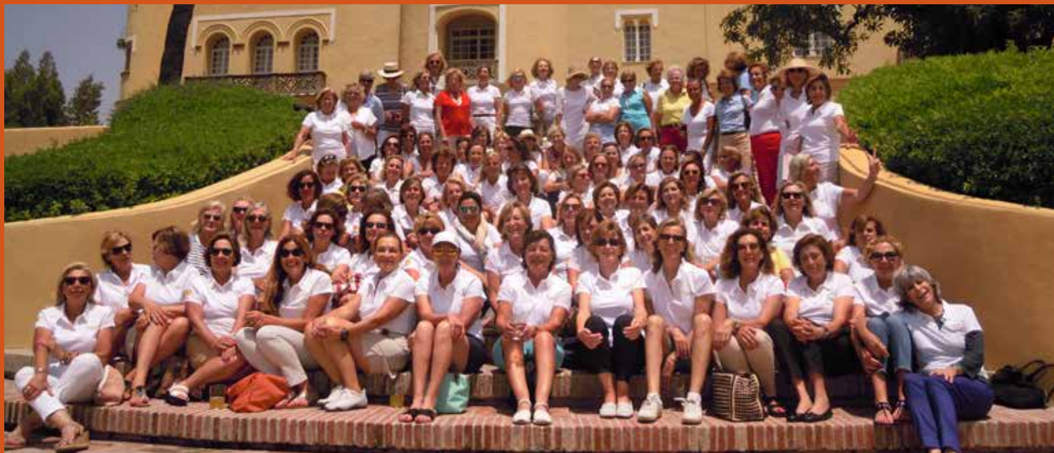
II GRAN PREMIO DOBLES MONTECASTILLO AESGOLF DAMAS