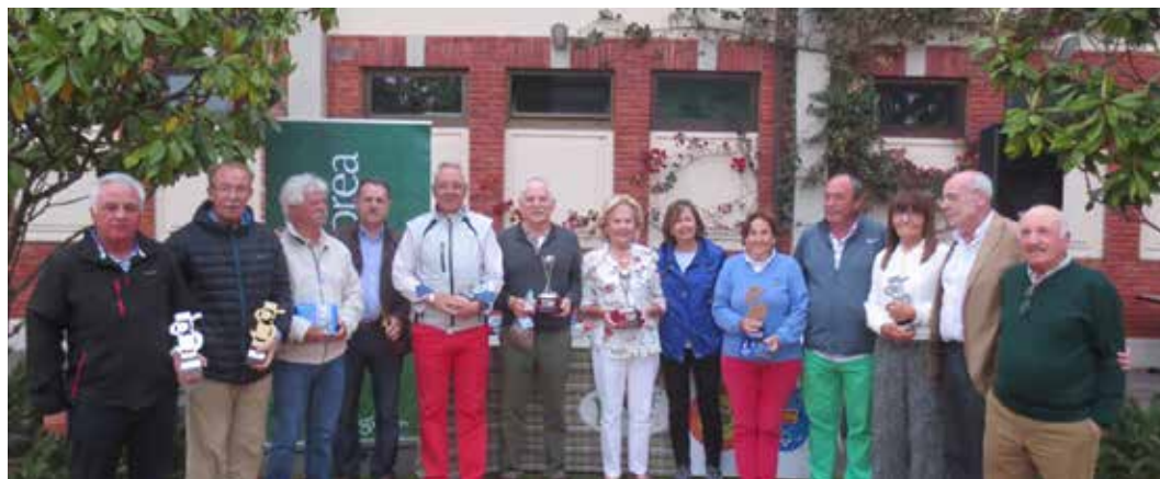
FINAL TRIANGULAR 'GIJÓN CIUDAD DEL DEPORTE', La Llorea, 2 de junio de 2016