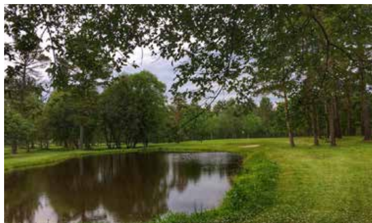
TROFEO AESGOLF Balneario de Guitiriz Golf, 9 de junio de 2016