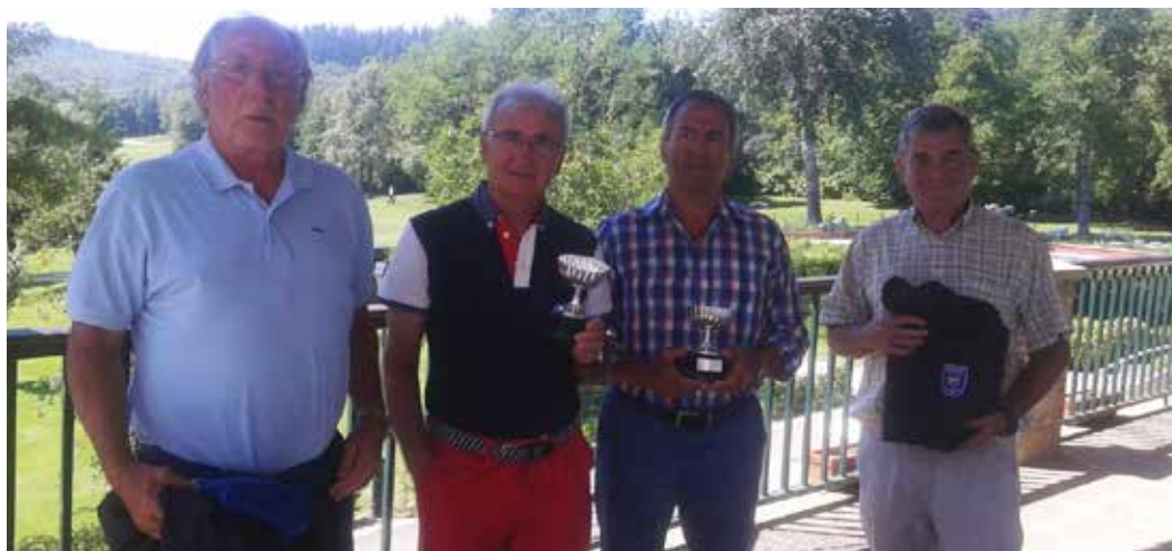
TROFEO VERANO AESGOLF Club Golf Larrabea, 28 de junio de 2016