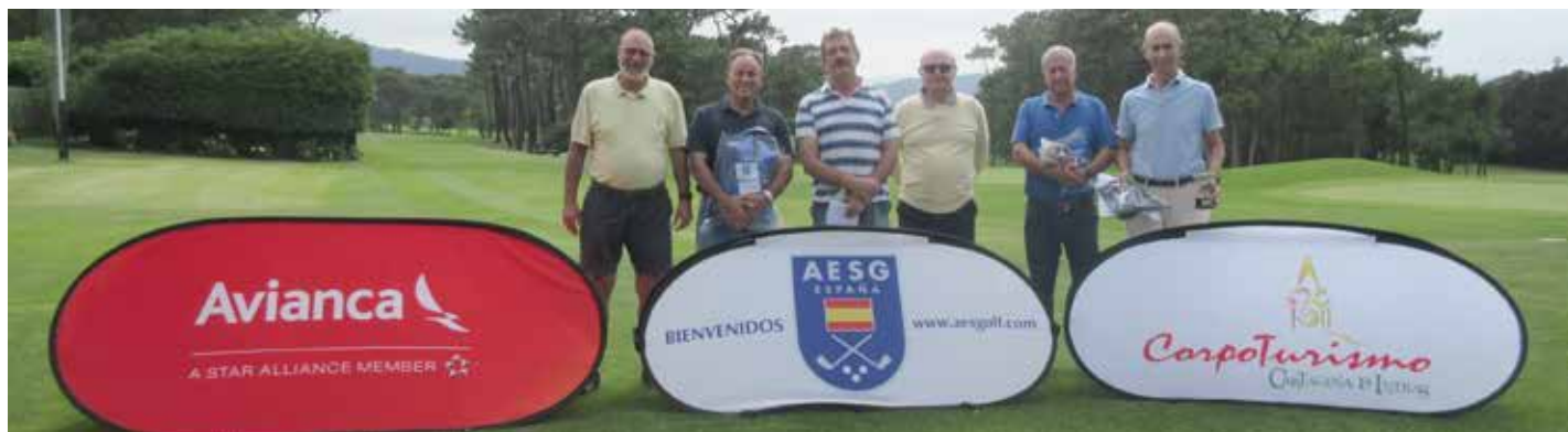
CARTAGENA DE INDIAS GOLF TOUR AESGOLF CAB. R.S.G. de Neguri, 6 de julio de 2016