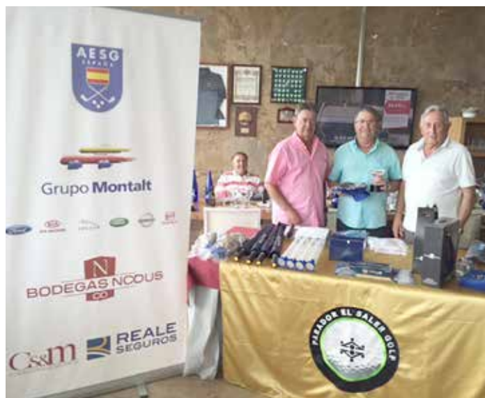
III ORDEN DEL MÉRITO AESGOLF C.V. CABALLEROS C.G. EL SALER, 7 de julio de 2016