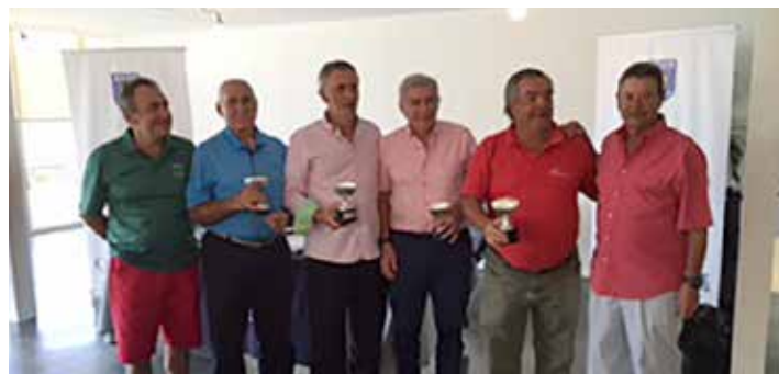
IV CIRCUITO POR EQUIPOS AESGOLF C.V. CABALLEROS, El Bosque Club de Golf 15 de junio 2016