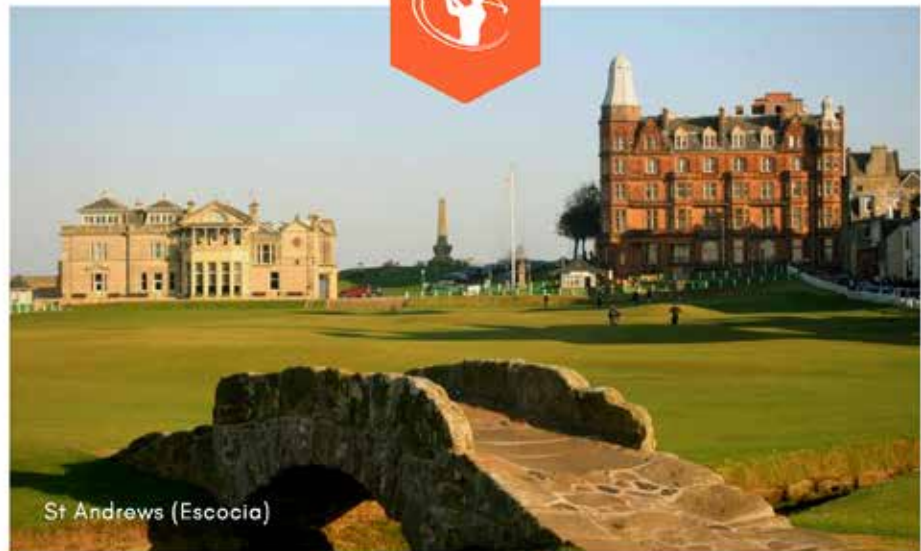
St Andrews (Escocia)

VIAJES PERSONALIZADOS A LOS MEJORES CAMPOS DE ST ANDREWS Y ALREDEDORES