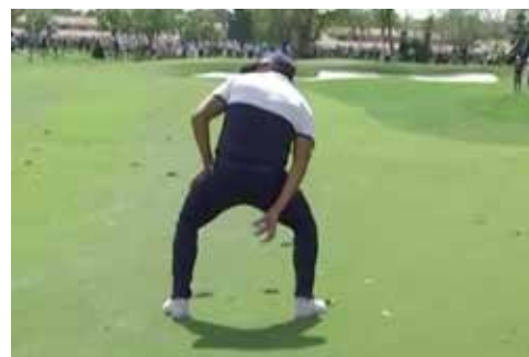
Técnica de dropaje utilizada por Ricky Fowler